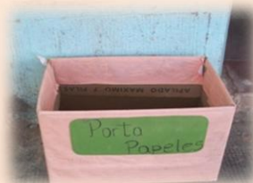
Papeleros en los patios