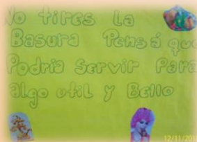
Carteles de concientización y señalización