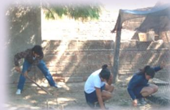
Tareas de desmalezado y riego