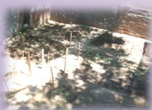
Sector de huerta

Especies sembradas: sandía, melón, zapallo, zanahoria, remolacha, tomate, acelga, lechuga, rabanito, choclo, brócoli, cebolla de verdeo, puerro, perejil, espinaca y arveja.