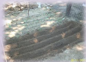
Surcos de siembra