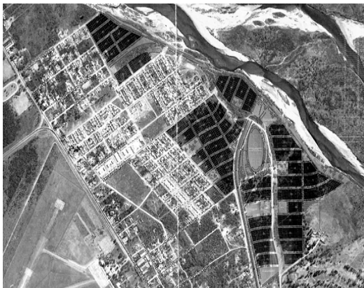
Figura 7. Obras en ejecución

La avenida costanera Norte es una prolongación de la costanera existente y según el trazado al que tuvimos acceso, pasa por la zona comprendida entre la boca toma y la salida del sifón que actualmente alimenta al canal San Martín, bordea el Barrio Aeropuerto y continúa hasta empalmar con la ruta provincial 208, punto en el cual está