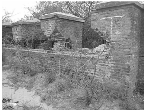
Figura 4. Almenas inclinadas (falta de apoyo)

También las almenas de las compuertas descargadoras se encuentran en estado ruinoso; a la almena del medio la falta la parte superior, se supone que ha sufrido saqueo (ver Fig. 5).