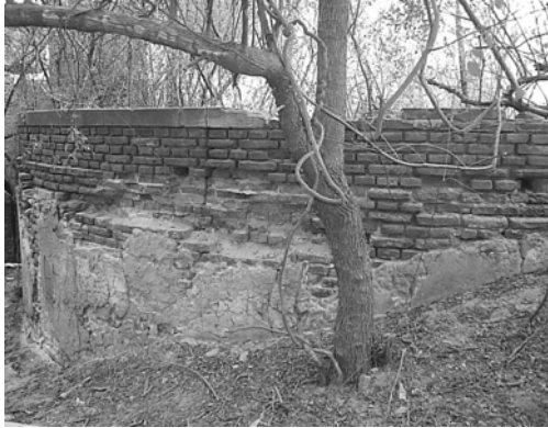
Figura 6. Muro de guardia deteriorado

El paso sobre la alcantarilla se encuentra en estado de abandono y faltan partes de los muretes superiores del ala aguas arriba (ver Fig. 2). El estado ruinoso del muro de guardia de la boca toma aguas arriba se aprecia en Fig. 6. De los sistemas de compuertas no han quedado vestigios, solo las guías sobre las cuales se deslizaban (ver Fig 2).