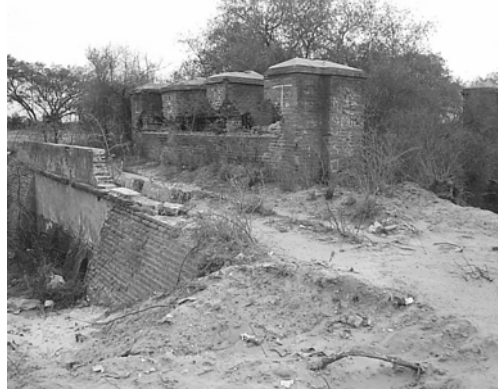
Figura 3. Boca toma vista desde aguas abajo

martín, el saqueo de piezas metálicas y la inclinación de las almenas del medio como consecuencia de la disminución de la sección de apoyo, cosa que se aprecia en Fig. 4.