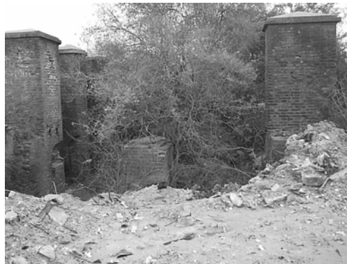
Figura 5. Almenas compuertas descargadoras

También las almenas de las compuertas descargadoras se encuentran en estado ruinoso; a la almena del medio la falta la parte superior, se supone que ha sufrido saqueo (ver Fig. 5).