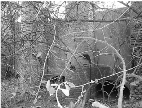
Figura 2. Boca toma vista desde aguas arriba

La boca toma se encuentra abandonada desde que comenzó a funcionar el sifón del canal San Martín. En las barrancas del río se pueden observar marcas que indican que el agua en época de crecidas llega hasta la zona de la obra, razón por la cual se ha realizado un relleno de protección. La zona de la boca toma aguas arriba está enlameada, por lo cual no se observan en las compuertas las secciones de pasaje plenas (ver Fig. 2).