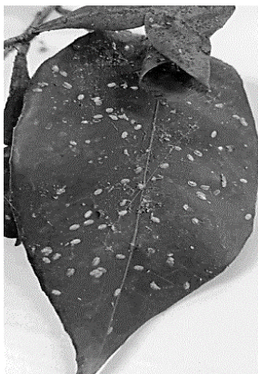
Fig.3 Lepidosaphes beckii : Infestación en hoja

En cuanto a las plagas relevadas, se observan múltiples colonias de cochinilla coma ( Lepidosaphes beckii ) sobre hojas, brotes nuevos, ramas, tronco y frutos (Fig. 3). Otro cóccido muy abundante que se observa en Fig. 4 y que se encuentra principalmente sobre ramitas, base de los frutos y ocasionalmente sobre hojas es la cochinilla algodonosa ( Icerya purchasi ).