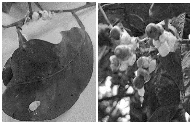
Fig.4 Icerya purchasi en hoja, ramas y base de frutos

Durante el mes de noviembre se detectó presencia de formas adultas de “mosca blanca” de los cítricos ( Dialeurodes citri ).