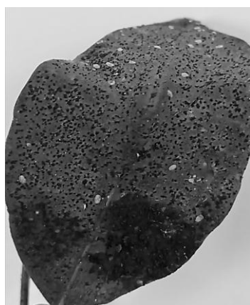
Fig. 1. Hoja atacada por fumagina

En un análisis realizado por el Laboratorio de Fitopatología de la Facultad de Agronomía de Azul (2022) se detectaron lesiones en frutos compatibles con la presencia de "antracnosis de los cítricos", producida por Colletotrichum sp. (Fig.2) Además se observan sintomatología en los hesperidios de melanosis causada por Diaporthe sp. , aunque no se encontró en las muestras analizadas el agente.