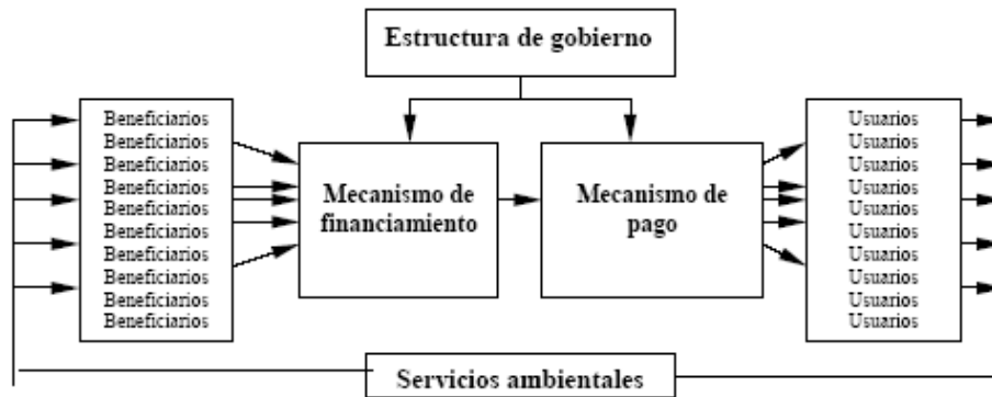
Figura 1. Estructura general de un mecanismo de PSA.